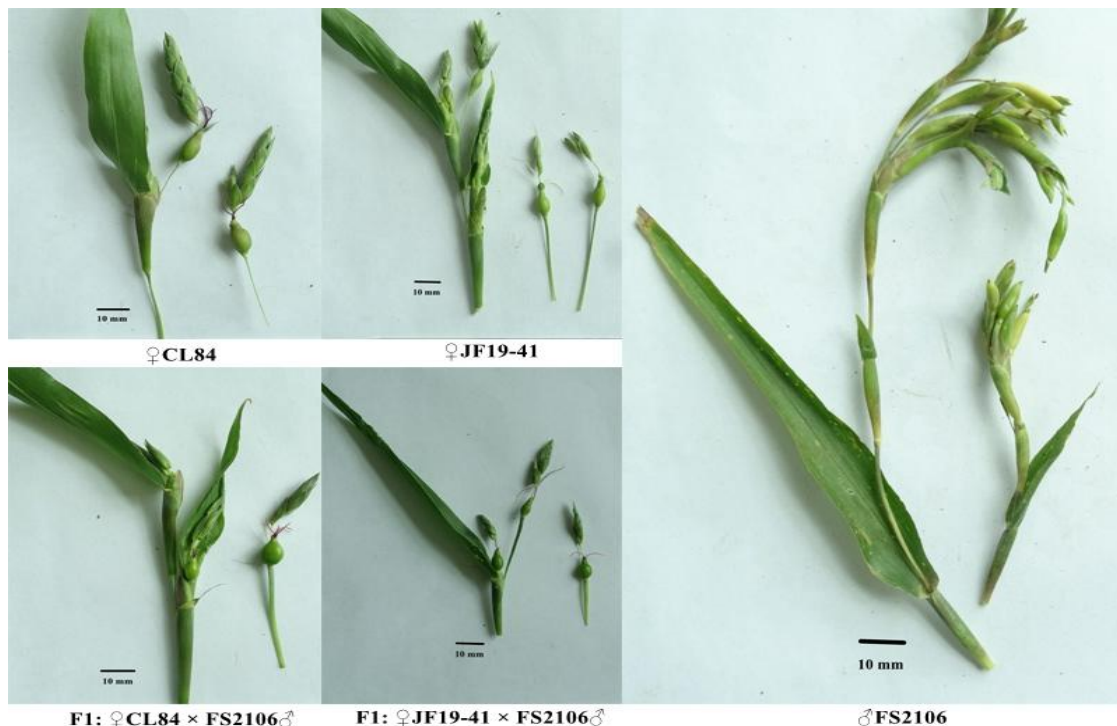
图2 亲本及 F 1 代植株雌穗育性及柱头颜色性状特征 Fig.2 Female sterility and stigma color traits of parental lines and F 1 plants