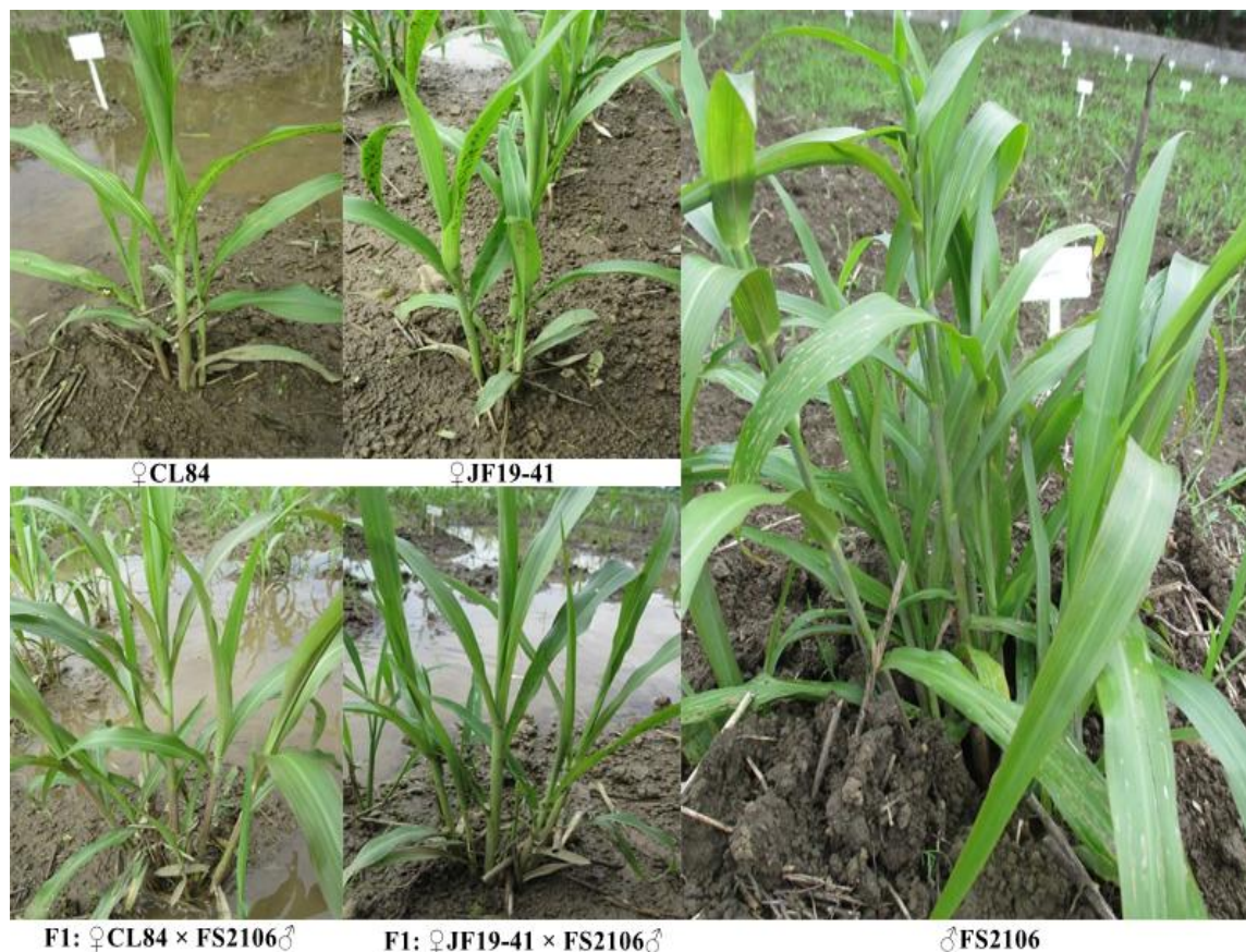
图 3 亲本及 F 1 代植株叶鞘颜色性状特征